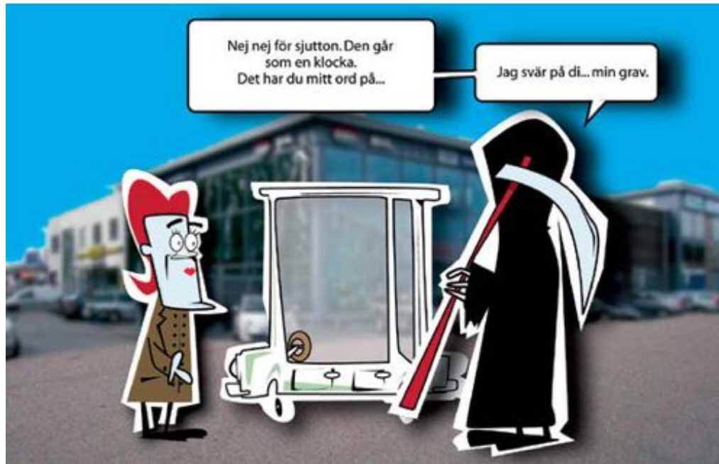
ILLUSTRATION: PATRIK AGEWALM