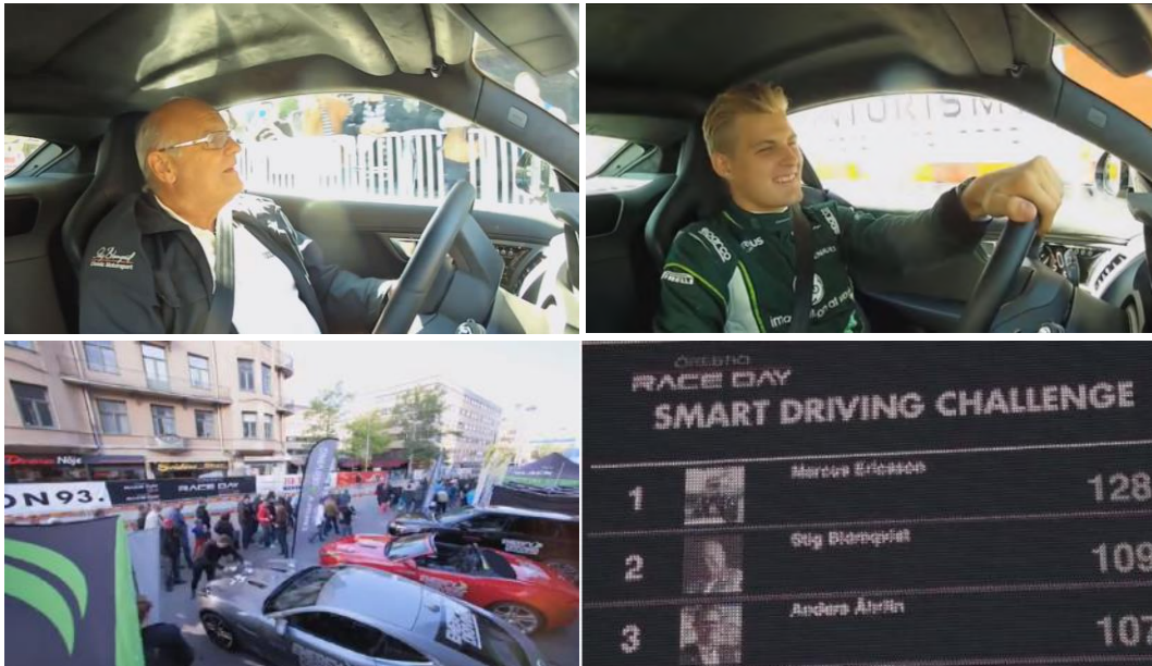
Figur 3 Stig Blomqvist och Marcus Ericsson utmanar i smart bilkörning under Örebro Race Day.

Örebro Race day genomförde en motordag utöver det vanligt, bland annat så kördes F1 mitt i Örebro stadskärna. Under dagen genomförde Greater Than en utmaning för att finna den smartaste bilföraren. Deltog gjorde bland annat den svenska F1-förare Marcus Ericsson och den före detta rallyvärdsmästaren Stig Blomqvist (se filmen: https://www.youtube.com/watch?v=PcwPBuFazXA ).