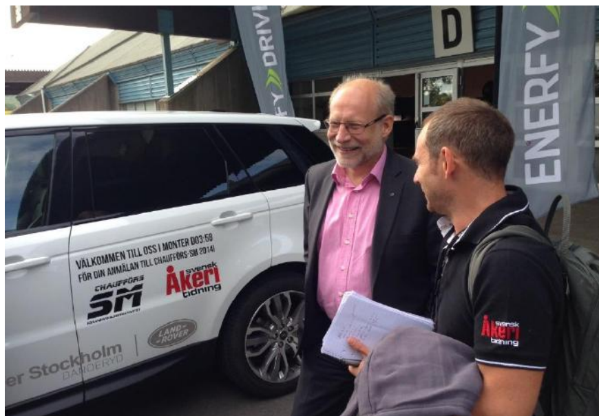
Figur 2 Dåvarande bostadsministern passade på att köra med Enerfy på Elmia.

Greater Than levererar plattformen till Chaufförs-SM som arrangeras av Svensk Åkeritidningen. I augusti delades priset ut till årets vinnare på mässan Lastbil på Elmia. Dåvarande infrastrukturministern Chatarina Elmsäter-Svärd skickade en hälsning till vinnarna och klargjorde att vinnarna av Chaufförs-SM har minskat bränslekonsumtionen med över 30% (se filmen: