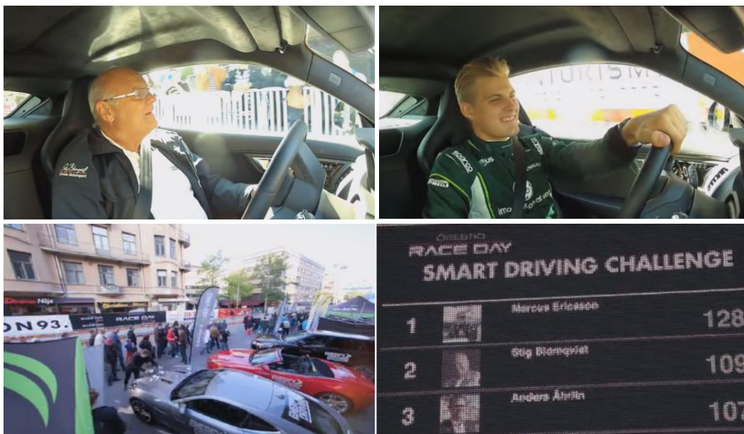
Figur 3 Stig Blomqvist och Marcus Ericsson utmanar i smart bilkörning under Örebro Race Day.

Örebro Race day genomförde en motordag utöver det vanligt, bland annat så kördes F1 mitt i Örebro stadskärna. Under dagen genomförde Greater Than en utmaning för att finna den smartaste bilföraren. Deltog gjorde bland annat den svenska F1-förare Marcus Ericsson och den före detta rallyvärdsmästaren Stig Blomqvist (se filmen: https://www.youtube.com/watch?v=PcwPBuFazXA ).